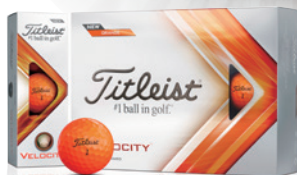
オレンジ 2022年9月23日発売