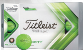
グリーン 2022年9月23日発売