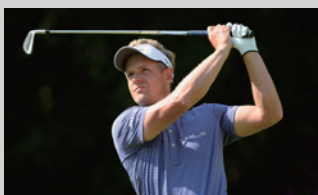
ルーク・ドナルド (PGAツアー)