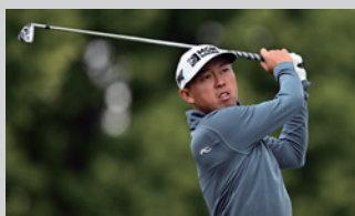
デービッド・リップスキー (PGAツアー)