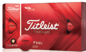
マットレッド 2022年9月23日発売